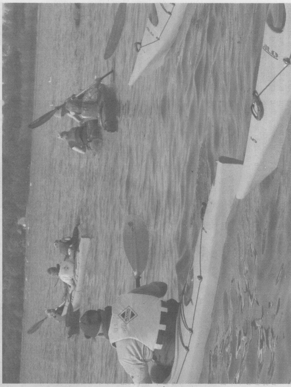
Så kom sommerskolen på vandet! Foran deltagerne ligger en skøn tur langs kysten i de lange slanke fartøjer.

»Jeg prøvede for 15 år siden og syntes, det var ret spændende, men det gik bare i sig selv igen. Jeg husker det som rigtig fedt, og når man ser folk derude, ser det jo fantastisk ud. Så jeg synes, sommerskolen er et rigtig godt tilbud, hvor man kan snuse til det under betryggende vilkår. Det virker mere overskueligt end at melde sig ind i en klub,« siger hun, inden hun skubber kajakken i vandet og forsigtigt svinger det ene ben indenbords.